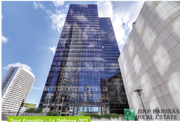
Tour Franklin - La Défense (92)

Le 30 septembre 2019, votre SCPI a cédé, à un prix net vendeur de 2,83 M€ , les lots de bureaux qu'elle détenait en indivision au sein de la Tour Franklin, à La Défense (92). Cette cession reflète la stratégie de rotation du patrimoine , mise en œuvre par la SCPI afin de permettre son repositionnement sur la classe d'actifs de type ERP (Établissement Recevant du Public), dont les locaux commerciaux.